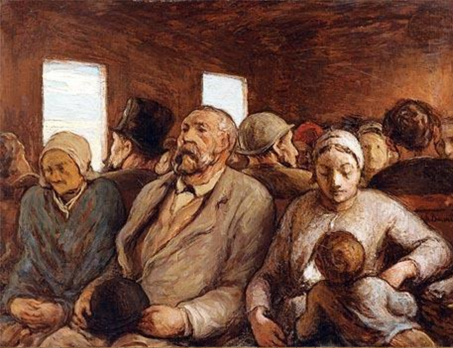
HONORÉ DAUMIER, TREČIOS KLASĖS KARIETA, XIX A. II PUSĖ