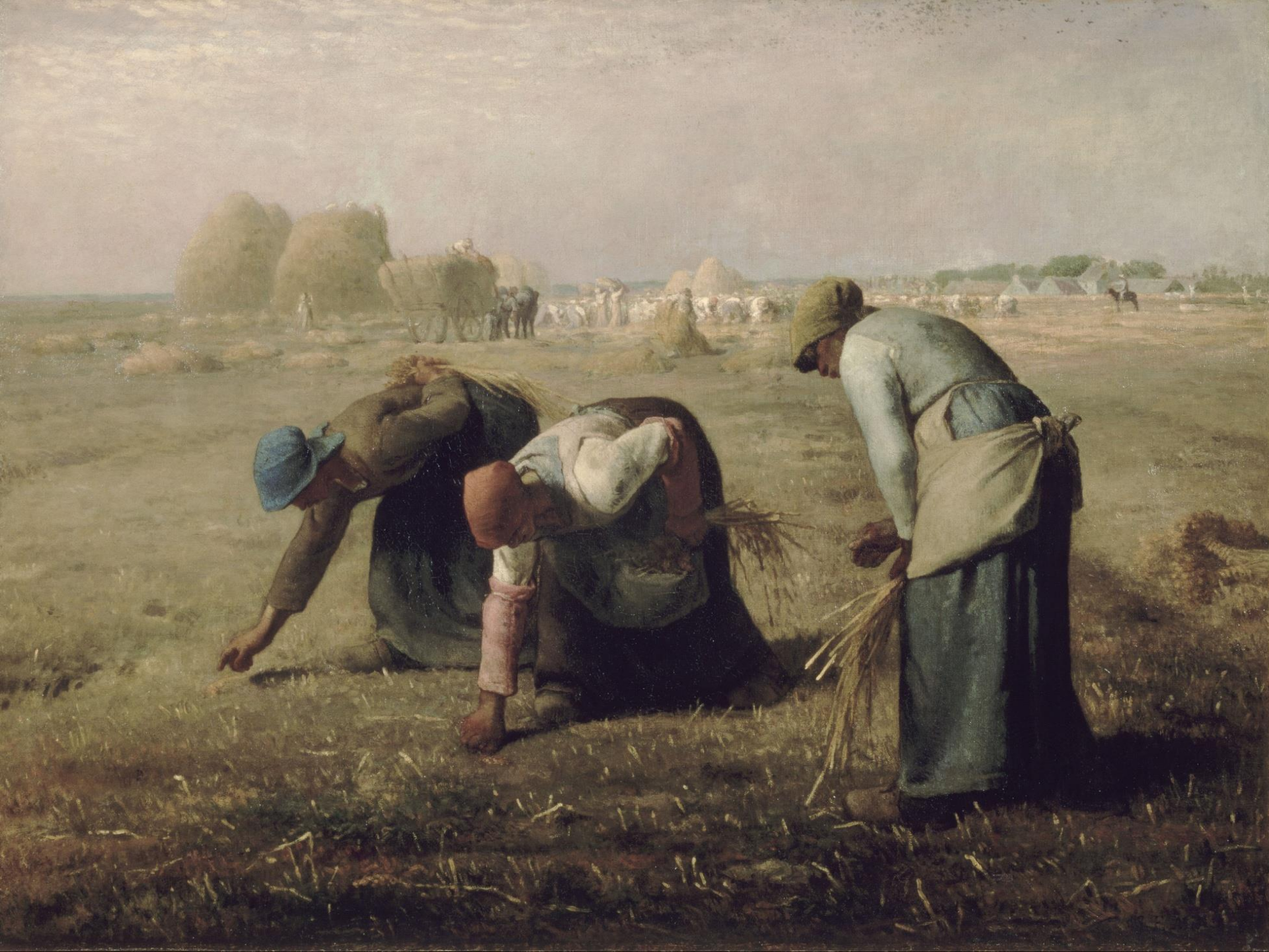
JEAN-FRANÇOIS MILLET, THE GLEANERS , 1857