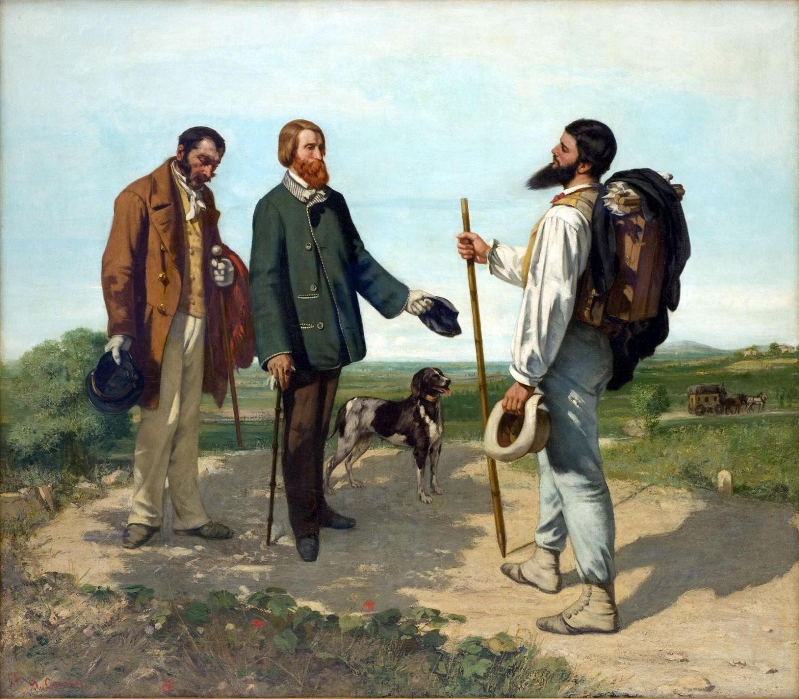
GUSTAVE COURBET, BONJOUR, MONSIEUR COURBET, 1854 M.